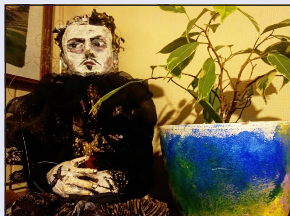
Кукла ручной работы «Hamlet»

6) Ваша мама работала актрисой кукольного театра, и вы довольно много времени проводили с ней на работе. Расскажите про свою жизнь за кулисами кукольного театра. Считаете ли вы, что именно мамина работа вдохновила вас на создание своих кукол?