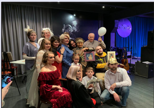
Премьера спектакля от театра «Ора» «Вертинский. Быть Актёром»

5) Я знаю, что вы работали в театре «Ора». Расскажите про свой опыт. Как вы туда попали? С кем работали?