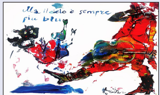
«Трубадур в сапогах», На рисунке строчка из песни Rino Gaetano «Ma il cielo è sempre più blu»

- Это ещё не выставка, но вполне это может быть выставкой, ведь некоторые такие «дорисованные» палитры превращаются в интересные рисунки, и я сама не перестаю этому удивляться, откуда что берётся и уже живёт своей собственной отдельной жизнью на картинке, которая когда-то была палитрой. Рисунки обретают имена, названия. И теперь будоражат ещё чьё-то воображение. Не только моё. Так что все предпосылки к выставке есть, возможно, когда серия будет достаточно объёмной, то её можно будет показать. Конечно, в палитре идею подбрасывает цвет, контур оставшихся пятен краски, это рождает ассоциации. Ничего заранее придумать нельзя. Линия, как мысль, ведёт тебя сама. Помнишь, в на-