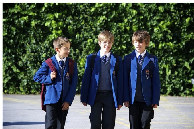
The King's School in Macclesfield