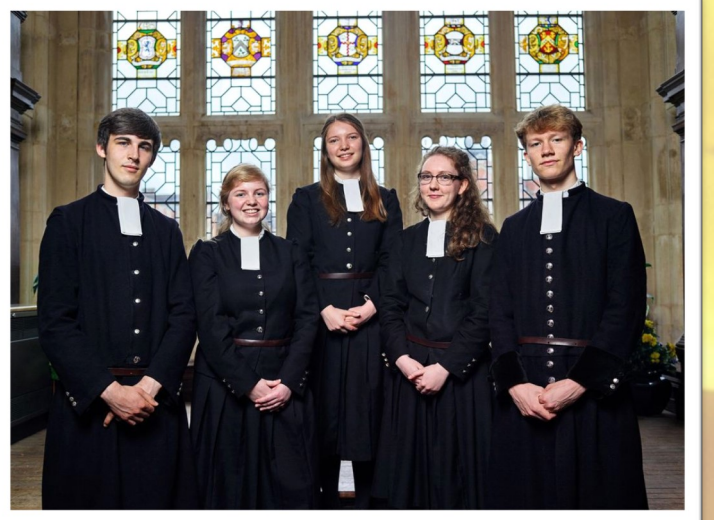
Christs Hospital School