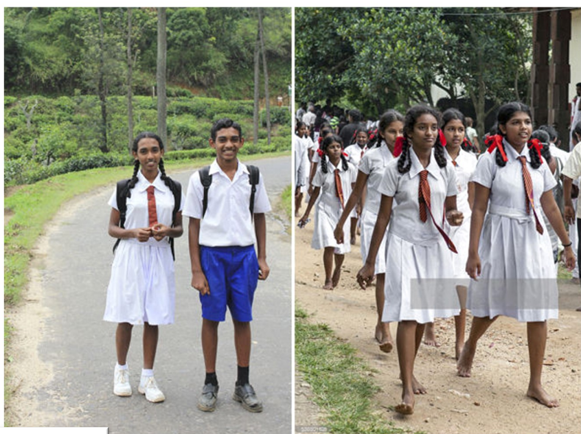
Форма в мусульманской школе Шри-Ланки

Форма для мальчиков состоит из белой рубашки с короткими рукавами и синих шорт (до 10 класса, около 15 лет). В торжественных случаях надевается белая рубашка с длинными рукава-