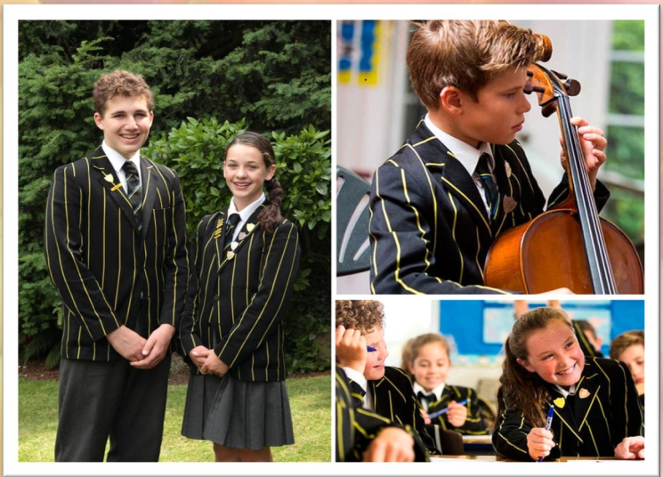
The Ryleys Preparatory School

Англия. В современной Англии в каждой школе своя форма. Здесь широко используется школьная символика и определенный стиль, которые выделяют учеников. Более того, в престижных школах Англии форма является предметом гордости. Пиджаки, брюки, галстуки и даже носки ни в коем случае не должны отклоняться от заданной традиции. Это считается не просто нарушением, но и неуважением к определенному учебному заведению.